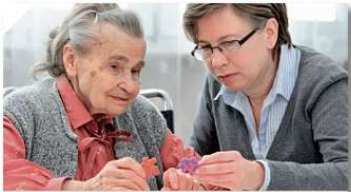
Actions de prévention de la perte d'autonomie : recueil de projets

La loi du 28 décembre 2015 relative à l'adaptation de la société au vieillissement a une nouvelle instance : la conférence des