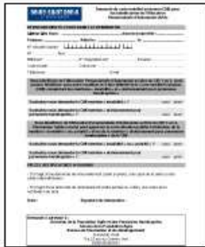
Demande hospitalisation proche aidant

Ou renseignez-vous auprès du CCAS de votre commune ou d'un CLIC .