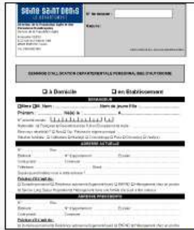
Formulaire demande ADPA