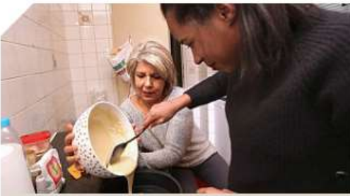
Accueil familial L'accueil familial des personnes âgées et des personnes en situation de handicap

Le Département s'attache au développement d'une offre diversifiée de services pour favoriser le maintien à domicile, tout en contribuant au développement de l'offre d'hébergement et d'accompagnement des personnes âgées.