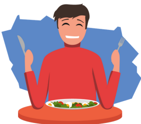
Je mange avec plaisir donc je suis