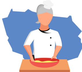
En cuisine avec Nicole