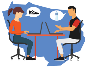
Je rencontre mon éducateur d'activité physique adaptée au diabète