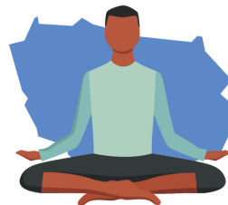
Les bienfaits de la relaxation sur ma vie avec le diabète